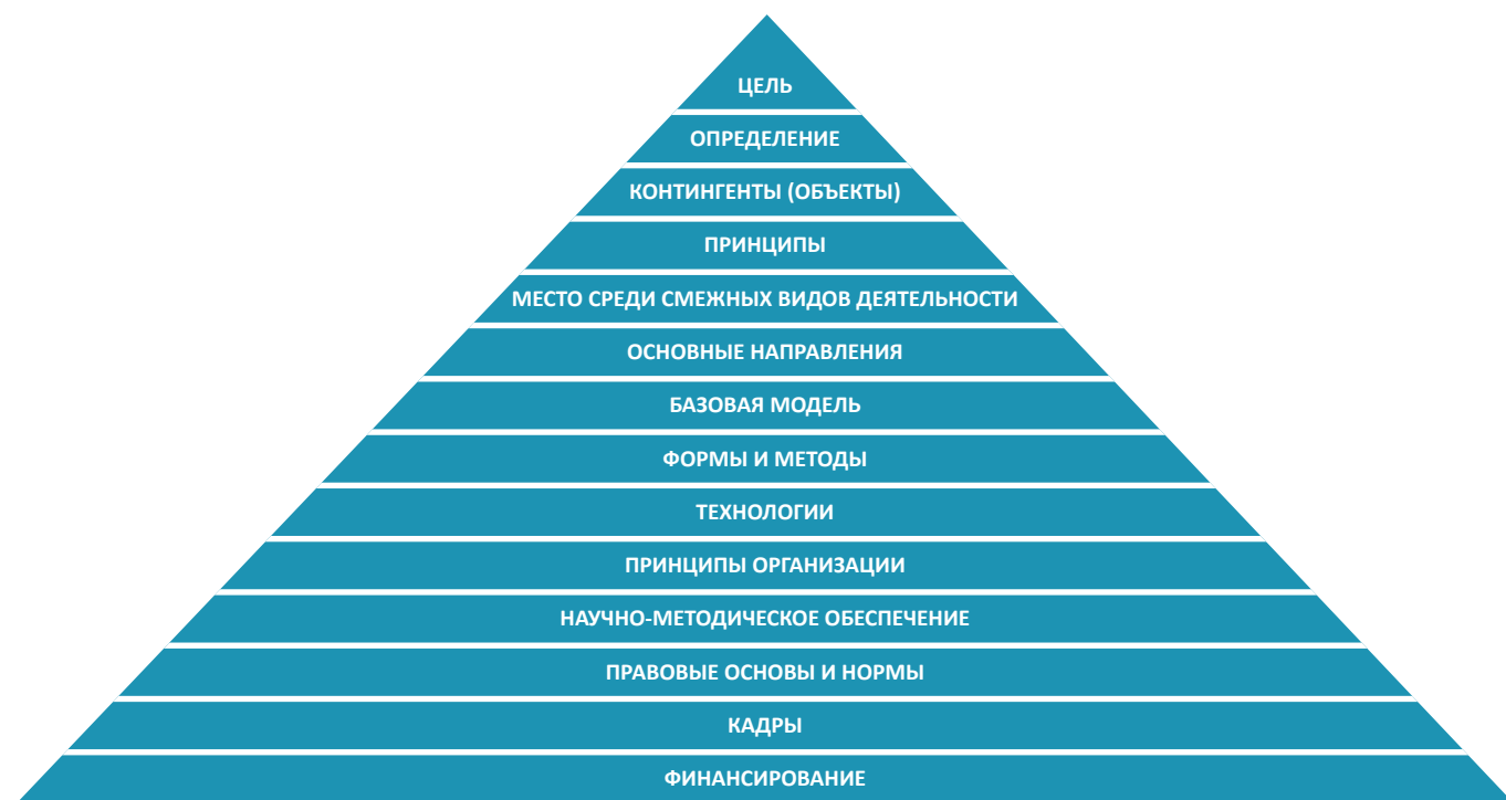
Рис. 1. Концепция отечественной медико-социальной работы (Мартыненко А. В., 1997)

В Глоссарии терминов по медико-социальной помощи Европейского регионального бюро ВОЗ медико-социальная работа определяется как «организованное социальное обслуживание в больнице или вне ее, с особым упором на связанные со здоровьем социальные проблемы» (Глоссарий терминов по медико-социальной помощи. Европейское региональное бюро ВОЗ).