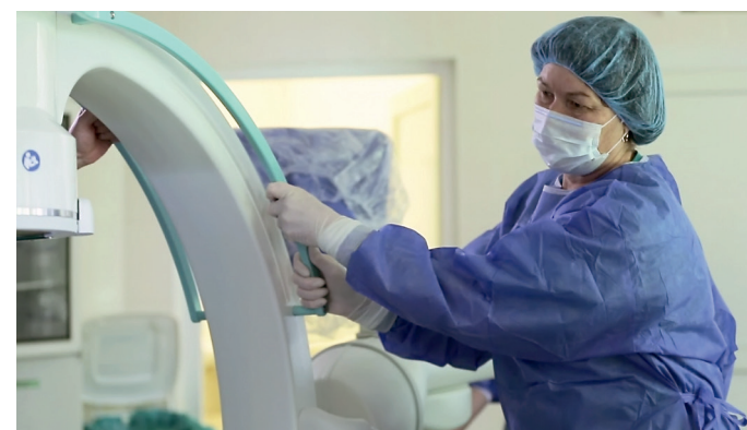
▲ Подготовка операционной