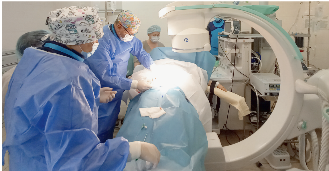
▲ Один из этапов операции

Сложную многоэтапную операцию освоили и внедрили в Перинатальном центре Городской клинической больницы имени М. П. Кончаловского. Опытные специалисты помогают появиться на свет детям и спасают их мам от фатального кровотечения, используя при родоразрешении метод временной баллонной окклюзии общих подвздошных артерий.